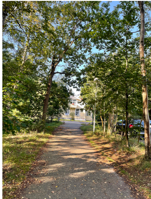
Vegetation och belagda ytor flyter samman. GC-väg Ljungenskolan.