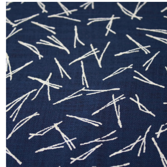
Mönster av barr i skärmväggar och brunnsbetäckningar