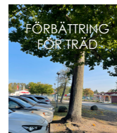
FÖRBÄTTRING FÖR TRÄD