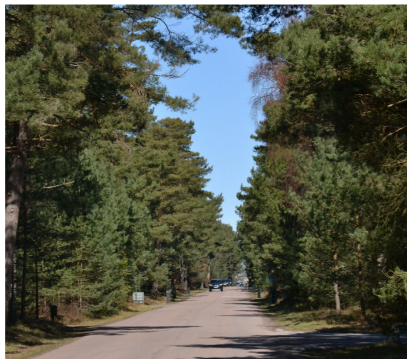
Villagata i Ljunghusen

SVÄVANDE, TYDLIGT TAK, UNDER TRÄDKRONORNA, INRAMAT AV NATUREN