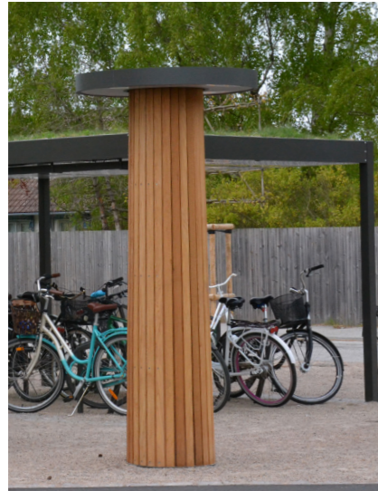
Billpost likt flertalet stationslägen i området.