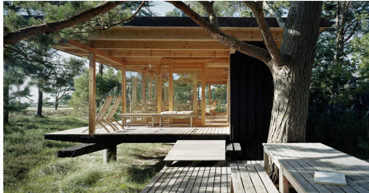
Landskapsarkitekt Per Fribergs sommarhus i Ljunghusen. Huset ger intrycket att "sväva" ovan naturen och tillåter träd och vegetation att växa kvar fritt runtom. Gränserna mellan inne och ute, befintligt och adderat, suddas ut.