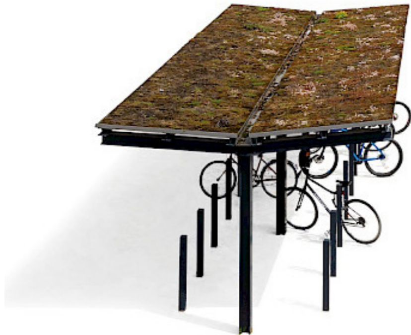
Cykelväderskydd med inspiration från Per Fribergs sommarhus. Ängstak istället för sedumtak.