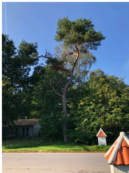
Vackra träd. Lokala tegeltorn. Korsning Storvägen/väg 100.