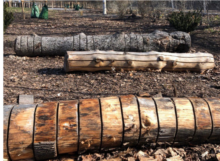
Nedtagna träd bevaras på platsen som faunadepåer.