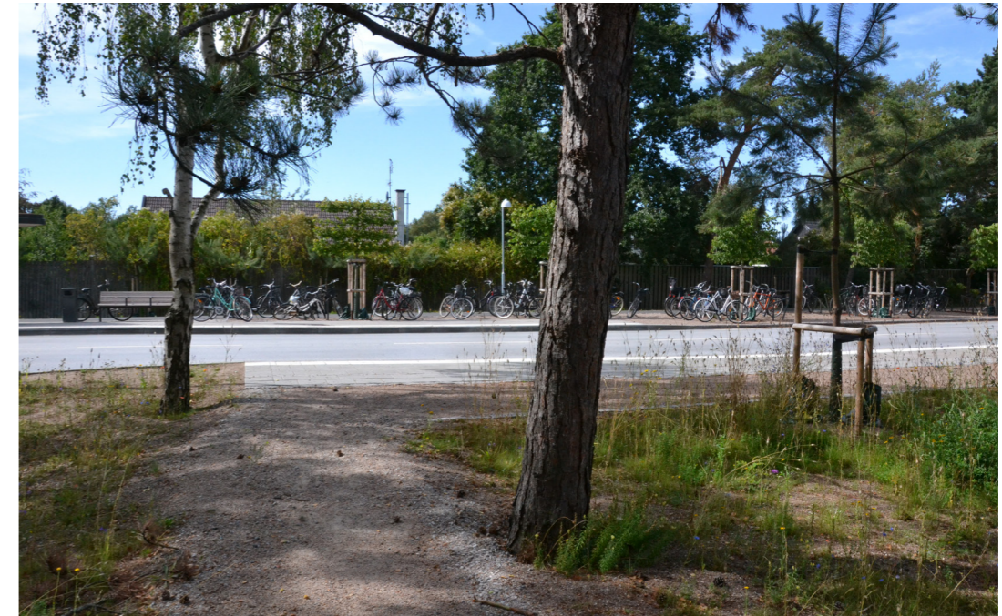
Karaktärsfulla träd behålls i största möjliga mån. G/C-passager sträcks varsamt genom befintliga träd och vegetation.