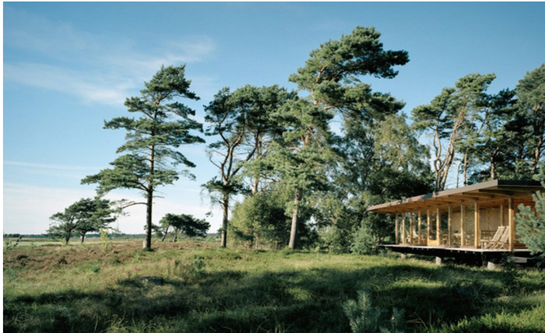
Landskapsarkitekt Per Fribergs sommarhus i Ljunghusen. Det tunga utskjutande taket i rejäla dimensioner av trä som skjuter ut över de vertikala träpelarna gör sig väl i kontrast till tallarna och naturmarkens organiska former.