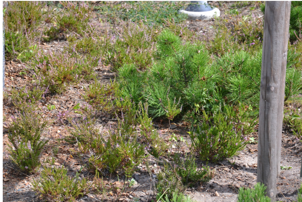
"Ljunghav", plantering med barrskogskaraktär. Pendlarparkering vid Skanör Haga.