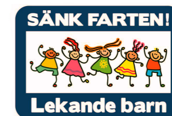
Skylt för att uppmärksamma trafikanter på skolan och barnens närvaro. Hastighetsänkande åtgärder.

GEDIGNA MATERIAL, ÅLDRAS MED VÄRDIGHET, INSPIRATION FRÅN SKOGEN