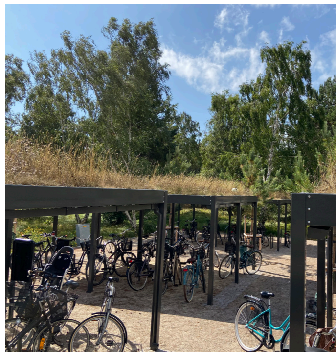
Ängsplanering på cykeltak. Skanör Haga