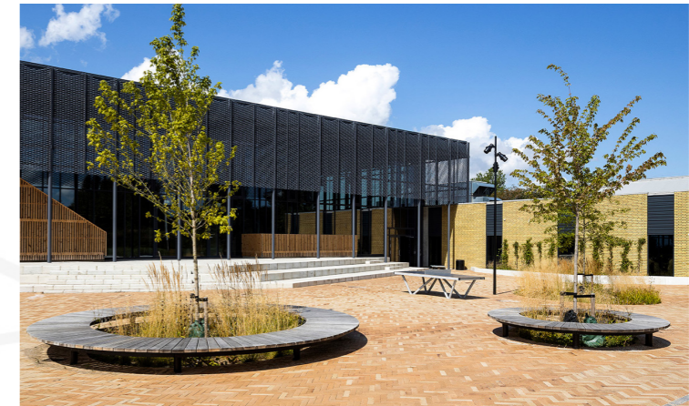
Gedigna material- bänk med vild plantering och träd. Kan fås med ryggstöd.