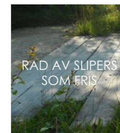
RAD AV SLIPERS SOM FRIS